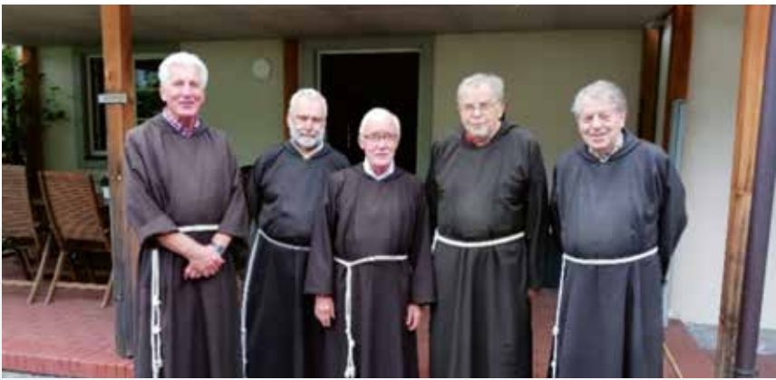
Brüdergemeinschaft, ohne Dhil