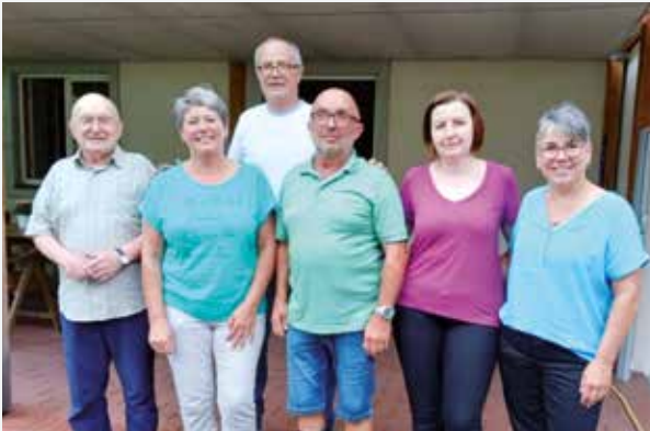
Angestellte und Mitarbeiter...