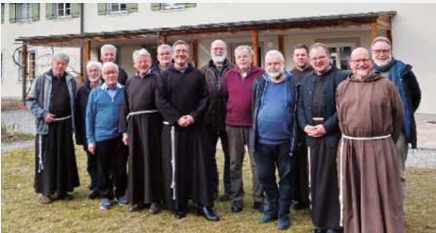
Begegnung mit Provinzleitung