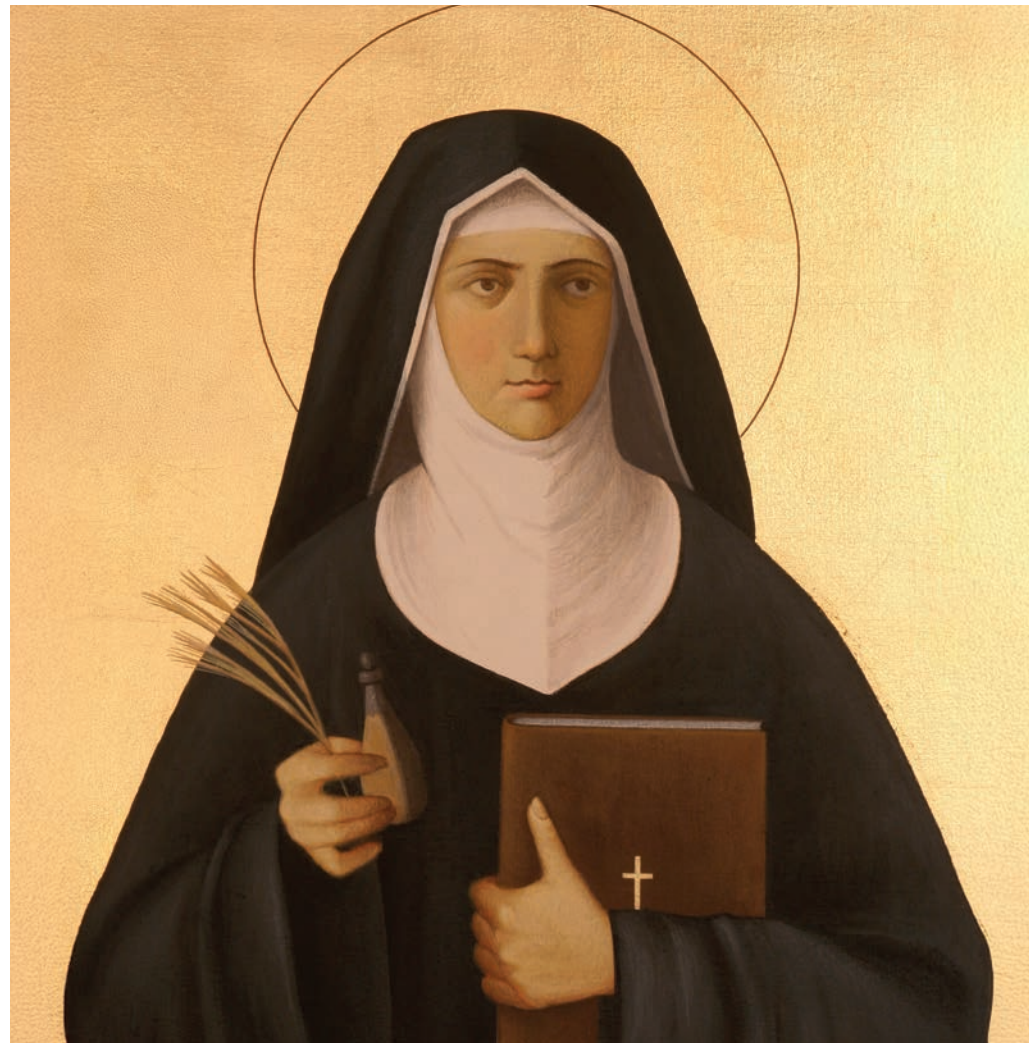
Hildegard von Bingen

Frei und mutig aus dem Glauben: Oft wird Mystik mit Kontemplation verbunden, doch die christliche Mystik war nie nur Rückzug, sondern vor allem Quelle von Widerstand und Tat.